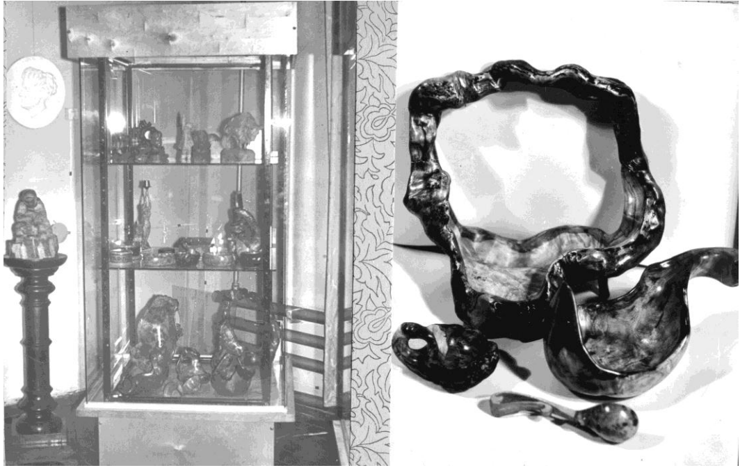
27 апреля 1984 г. Открытие персональной выставки в Краеведческом музее г. Шадринска.