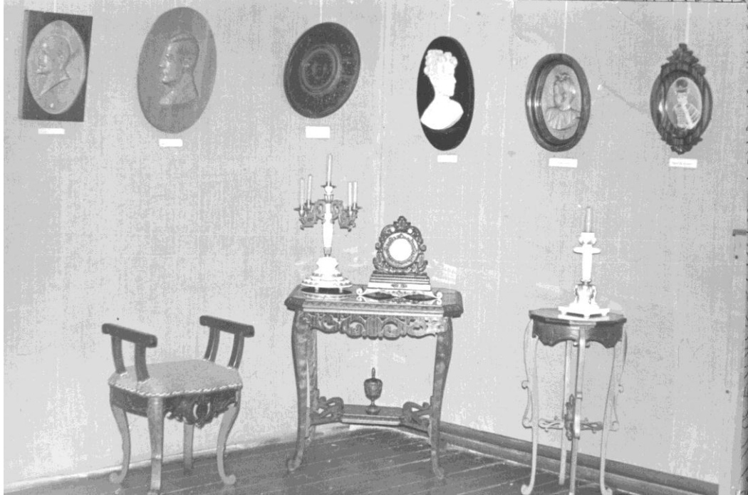
27 апреля 1984 г. Открытие персональной выставки в Краеведческом музее г. Шадринска.

27 апреля 1984 г. открытие персональной выставки С. В. Пантелеева в краеведческом музее г. Шадринска