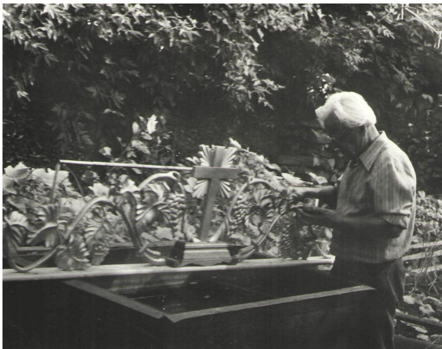
Помощь в реставрации Воскресенской церкви г. Шадринск