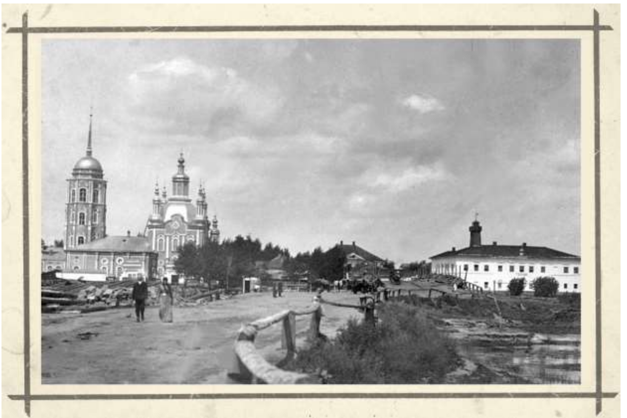
Вид с моста на исторический центр шадринск