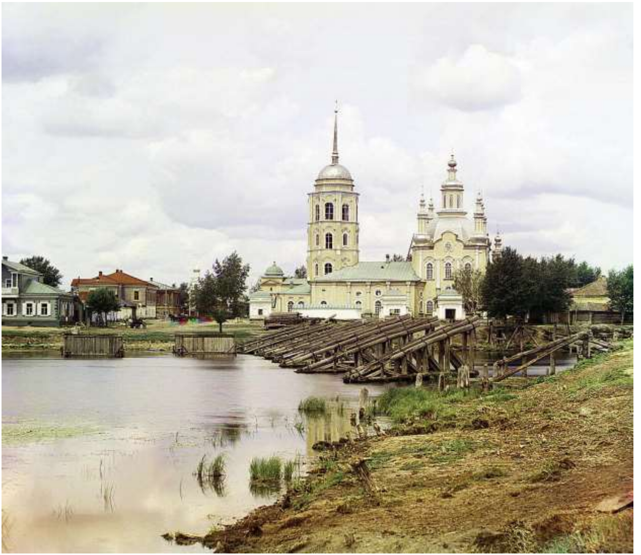
Мостъ черезъ рѣку Усегъ.