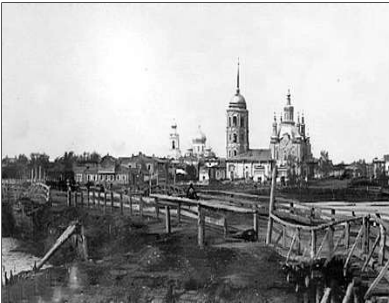
Город у речной переправы