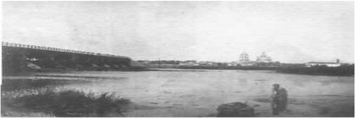
мост начала XX века